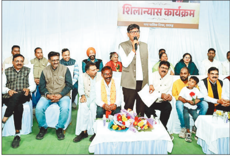
कार्यक्रम को संबोधित करते वित्त मंत्री।

पुसौर। पुसौर तहसील के पांच गांव छिछोर उमरिया, कोडपाली, पडिगाव, बड़े भंडार और केशला के दर्जनों ऐसे बड़े किसान हैं जिनका रकबा अभी भी एग्रीस्टेक में शो नहीं कर रहा है। इन किसानों ने बीते साल इस रकबे में धान बिक्री किया था, लेकिन इस साल शो नहीं कर रहा है। याने रकबा ही गायब है। इस साल एग्रीस्टेक में संबंधित रकबा नहीं दिखाया जिसके कारण पटवारी, तहसील और सोसायटी कई बार किसानों ने चक्कर काटा, लेकिन सुधार नहीं हो सका। ज्ञात हो कि एग्रीस्टेक में रकबा शामिल करने की प्रक्रिया को तहसील कार्यालय सहित संबंधित अन्य लोगों को