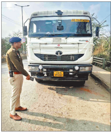
रिंग रोड पर बेतरतीब खड़े वाहनों पर कार्रवाई करते पुलिस अधिकारी।

■ यातायात पुलिस ने कुछ वाहनों पर की चालानी कार्रवाई, चालकों को दी गई हिदायत